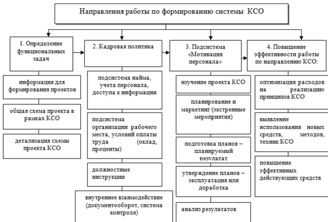
Рисунок 1 - Направления работы по формированию системы КСО 36

- Второй подход к формированию системы корпоративной социальной ответственности в организациях заключается во взаимосвязанной деятельности центров управления организацией. Любые меры социально ответственного менеджмента на предприятии могут быть реализованы только в случае четкого документального утверждения их перечня, исполнителей, объемов финансирования, сроков реализации и тому подобное. То есть, формирование корпоративной социальной ответственности предприятия должна начинаться с разработки программных документов (политики) КСО в избранных направлениях (сферах).