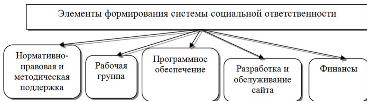
Рисунок 2 - Элементы формирования системы социальной ответственности 37

К сферам проявления корпоративной социальной ответственности следует отнести: